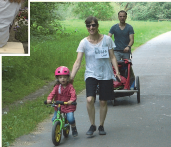
Jung und Alt: Alle machen mit.