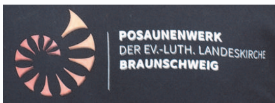
Der Posaunenchor aus Ahlum spielt auf zur Verabschiedung des alten und zur Begrüßung des neuen Kirchenvorstands.