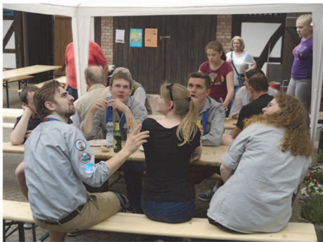
Ruhen und Rasten gehört immer dazu