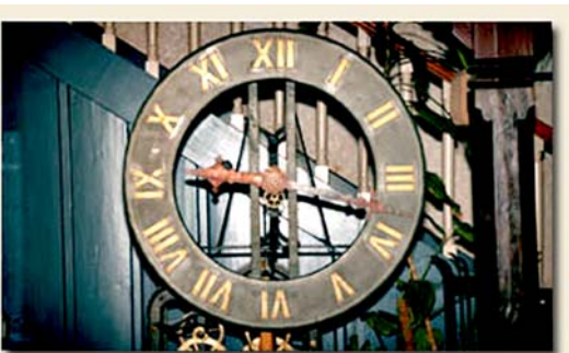
Einmal die Zeit anhalten können... Ruhe..

Aber auch sich selbst kann man auf eine andere Art und Weise begegnen: Wir werden uns mit der Geschichte ( aus Johannes 3, 1-21 ) von Nikodemus beschäftigen, der eines Tages Jesus aufsucht.