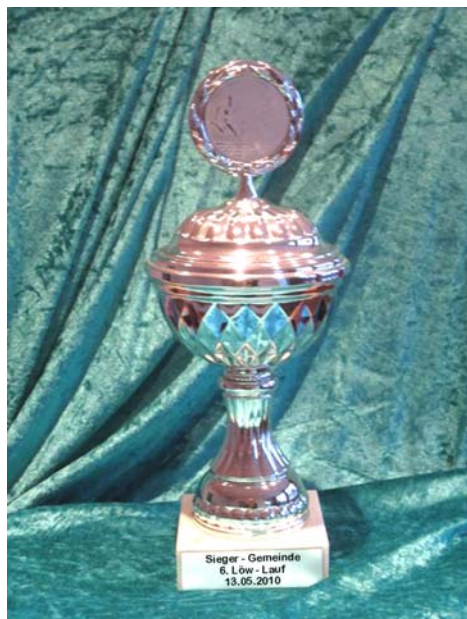
Erster Lammer Pokal von 2010, Zweiter Sieg 2011, und in 2013 mit vereinten Kräften wieder?

In den Jahren 2010 und 2011 ist die St. Marien Gemeinde Sieger des Löw+ Laufes geworden und konnte den Pokal mit nach Lamme nehmen. Natürlich versuchen wir als Gemeinde dies jedes Jahr neu. Im letzten Jahr hat uns die Kreuzgemeinde in Alt-Lehndorf überholt. In diesem Jahr wollen wir den Pokal wieder nach Lamme holen. Das schaffen wir aber nur mit Ihrer und Eurer Unterstützung! Im letzten Jahr war die freiwillige Feuerwehr Lamme dabei.