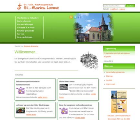
Ansicht unserer neu gestalteten Homepage

Im Dezember haben wir die Startseite geändert, um aktuellen Meldungen mehr Raum zu geben. Die Seite bietet nun einen schnellen Überblick über aktuelle Geschehnisse, Veranstaltungen und Aktionen Ihrer Kirchengemeinde. Weitergehende Informationen können Sie durch Anklicken des Links „weiter lesen“ aufrufen.