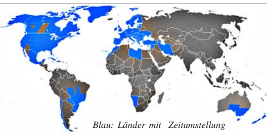
Blau: Länder mit Zeitumstellung

Die nächste Zeitumstellung ist am Sonntag, dem 31.03.2013.