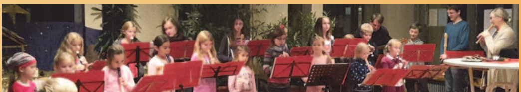
Eröffnung des Lebendigen Adventskalenders mit Flötenkindern 2015

Wir bitten die Gäste, sich ihre eigene Tasse mitzubringen!