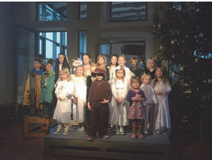
Die Schauspielerinnen und Schauspieler von 2016