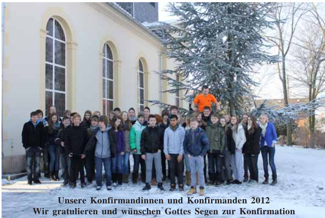
Unsere Konfirmandinnen und Konfirmanden 2012 Wir gratulieren und wünschen Gottes Segen zur Konfirmation