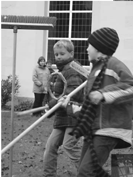
Ritterspiele ohne Pferde.