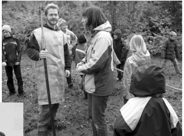
Letzte Absprachen für die Ritterspiele.