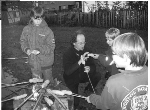
Stockbrotbacken vor der Übernachtung.