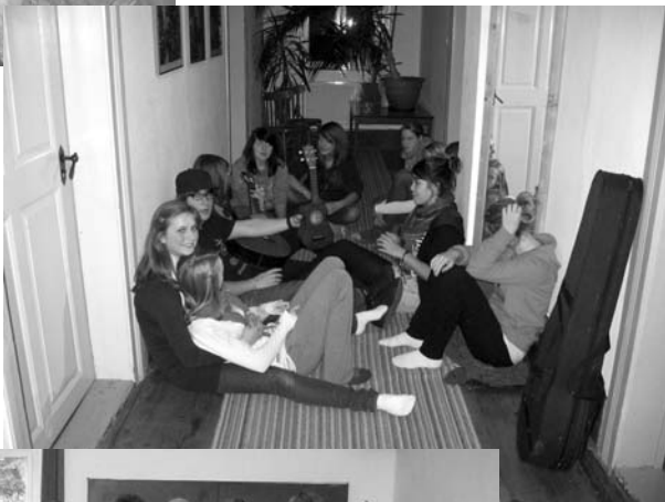
Geselliges Beisammensein im Flur