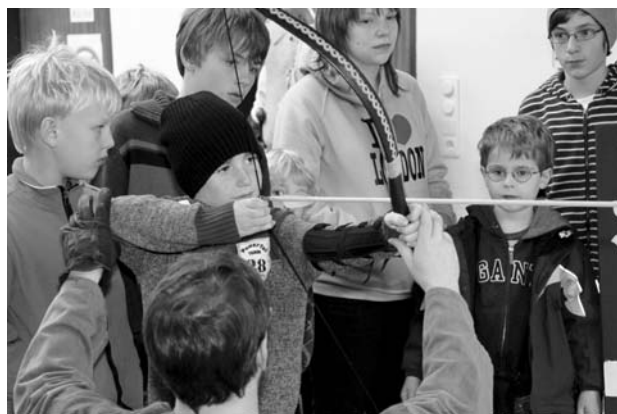
Bogenschießen war eine der besonderen Attraktionen.