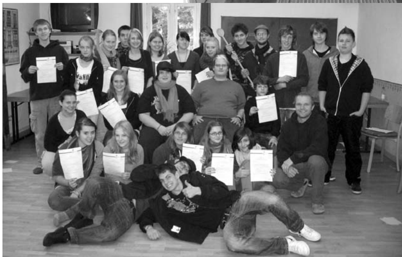
Gruppenfoto mit Teilnahmezertifikaten