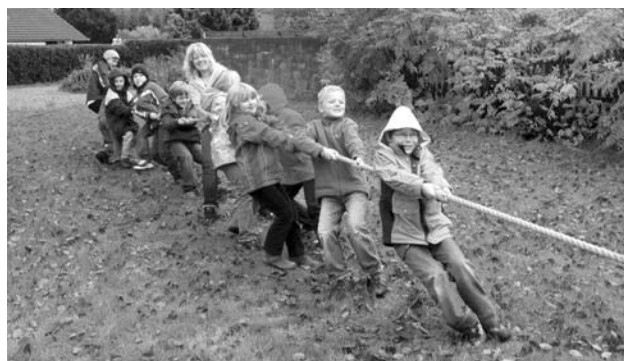
Zum Kräfteressen gab es ein Tauziehen.