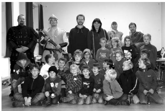
Die Kinder, die im Kirchhaus übernachtet haben, mit Mitgliedern von Historia Magica und Wilhelm Tell.